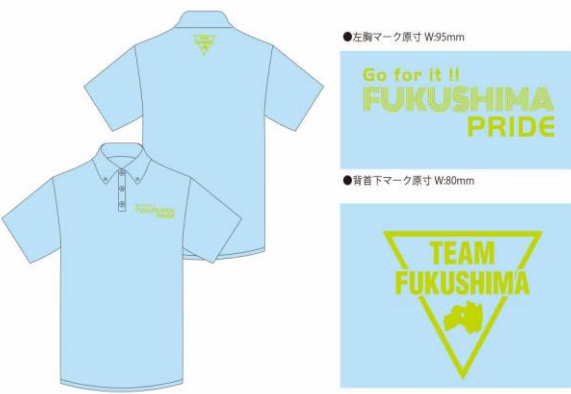
●チャリティーポロシャツ デザインイメージ 本体色：サックス