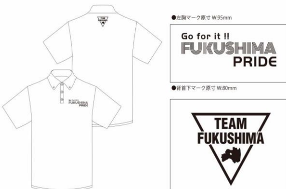
●チャリティーポロシャツ デザインイメージ 本体色：ホワイト