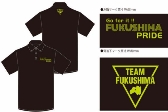
●チャリティーポロシャツ デザインイメージ 本体色：ブラック