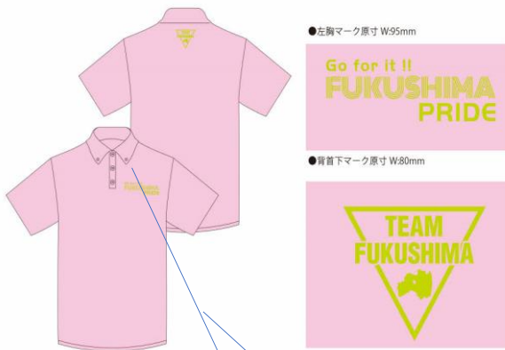
●チャリティーポロシャツ デザインイメージ 本体色：ピンク